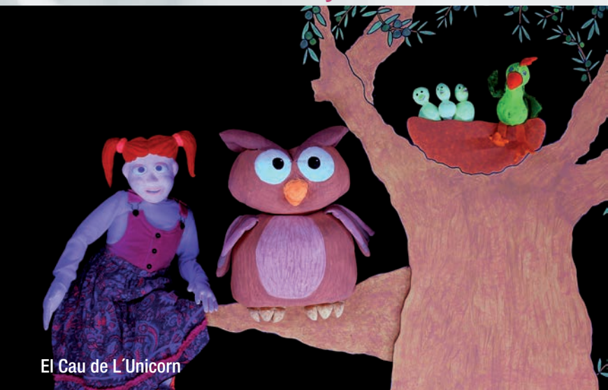
El Cau de L'Unicorn